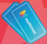
ENTRADAS A MULTICINES

ALGUNOS PREMIOS CON LOS QUE CONTAMOS SON: