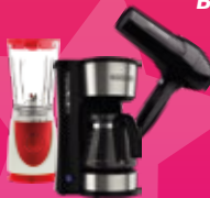
ARTÍCULOS DE TECNOLOGÍA